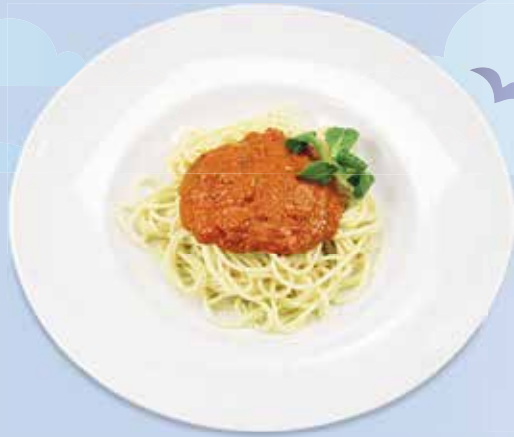
Nudeln Napoli oder Bolognese Nudeln mit Tomaten- oder Bolognese-Sauce CHF 9.00