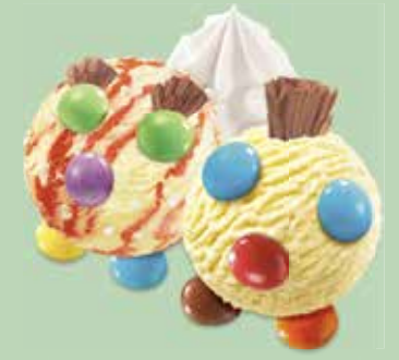
Coupe Smarties Vanille- und Vacherin-Rahmglace mit Smarties CHF 6.50