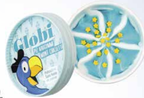
Globi Piz Kaugummi Rahmglace mit Kaugummiaroma und Zuckerdekor CHF 5.50