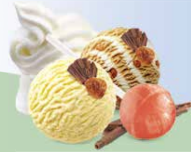
Coupe Pinocchio Vanille- und Caramel-Rahmglace mit Chupa Chup CHF 6.50