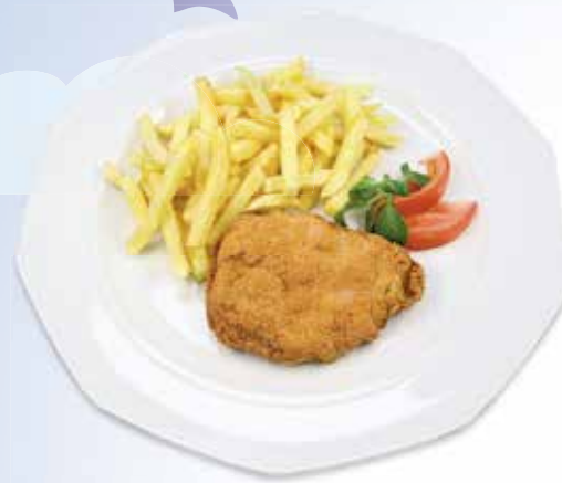
Schnipo Paniertes Schweinsschnitzel mit Pommes Frites CHF 10.50