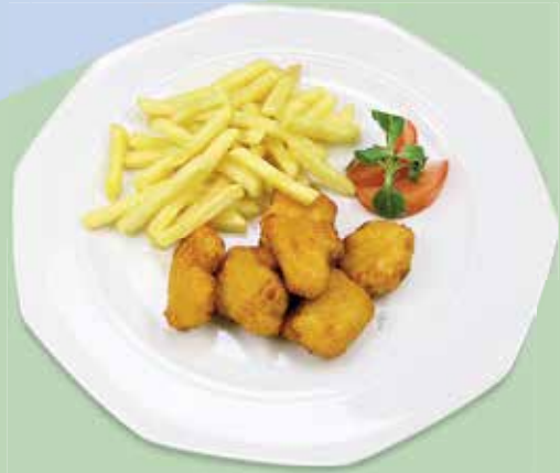
Chicken Nuggets 5 Chicken Nuggets mit Pommes Frites CHF 10.50