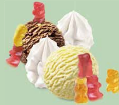
Coupe Haribo Choco-Brownies- und Vanille-Rahmglace mit Schokoladensauce und Gummibärli CHF 6.50