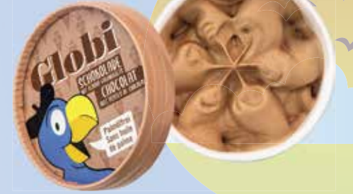
Globi Schokolade Schokoladen-Glace mit Goldnuggets CHF 5.50