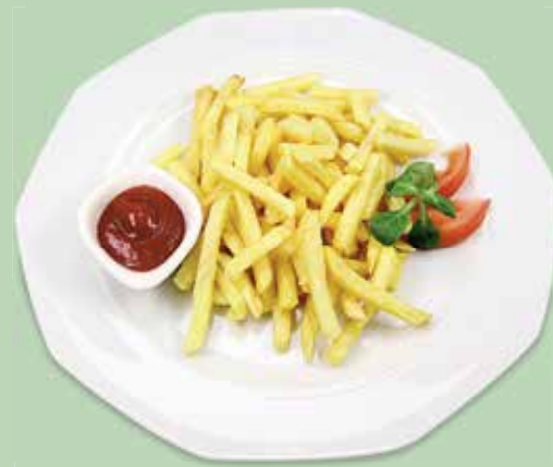
Portion Pommes Frites CHF 6.00