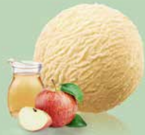
Sorbet Hochstamm Süssmost

Preis pro Kugel CHF 3.50 Rahmzuschlag CHF 1.50